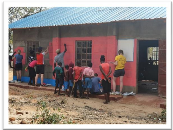
Der neugebaute Klassenraum an der Nzouni Primary School wird in den Schulfarben gestrichen.

Bei Interesse vermitteln wir gern weitere Volontärinnen und Volontäre – einfach melden!